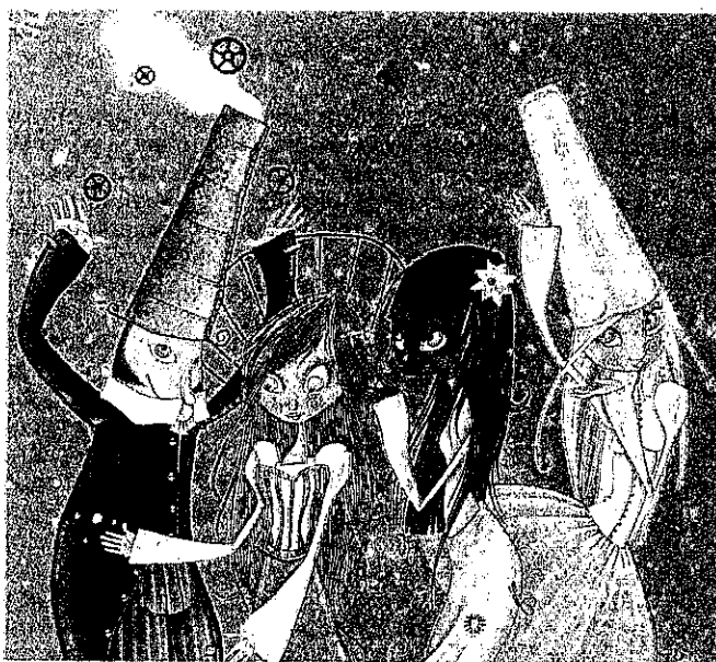
▶ Les voici réunis les quatre Fieris symbolisant les richesses de la ville de Seraing.